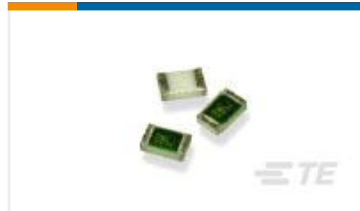
TE 零件编号1879215-3 CPF 0402 4K22 0.1% 25PPM 1K RL