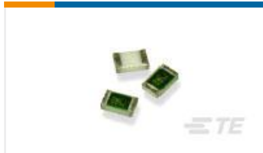
TE 零件编号4-1879215-2 CPF 0402 11K5 0.1% 25PPM 1K RL