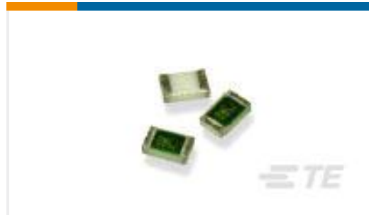
TE 零件编号6-1879215-6 CPF 0402 22K1 0.1% 25PPM 1K RL