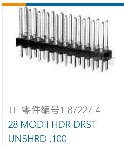
TE 零件编号1-87227-4 28 MODII HDR DRST UNSHRD .100