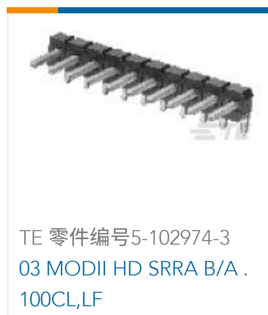
TE 零件编号5-102974-3 03 MODII HD SRRA B/A . 100CL,LF