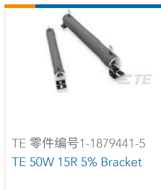
TE 零件编号1-1879441-5 TE 50W 15R 5% Bracket