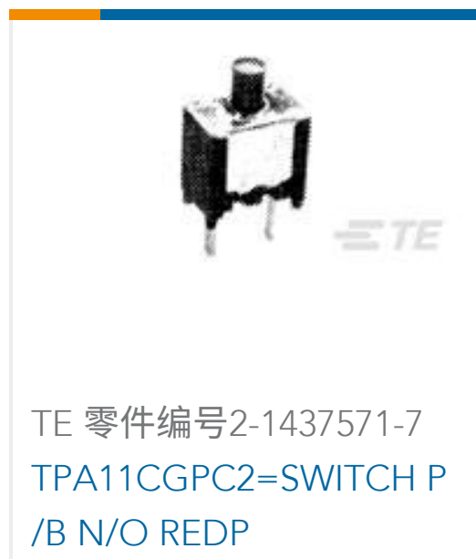
TE 零件编号2-1437571-7 TPA11CGPC2=SWITCH P /B N/O REDP