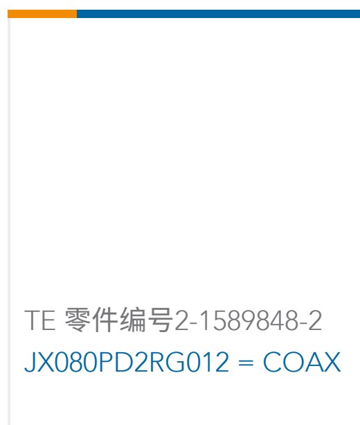
TE 零件编号2-1589848-2 JX080PD2RG012 = COAX