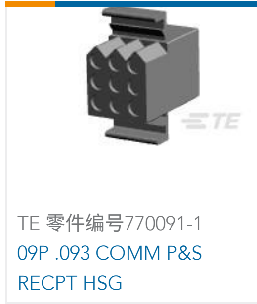
TE 零件编号770091-1 09P .093 COMM P&S RECPT HSG