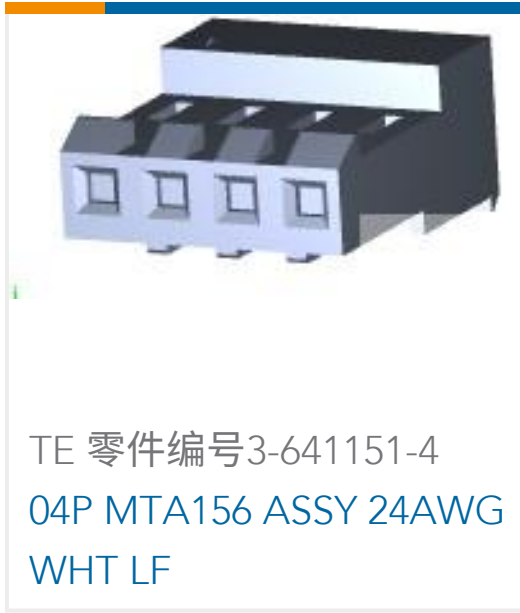
TE 零件编号3-641151-4 04P MTA156 ASSY 24AWG WHT LF